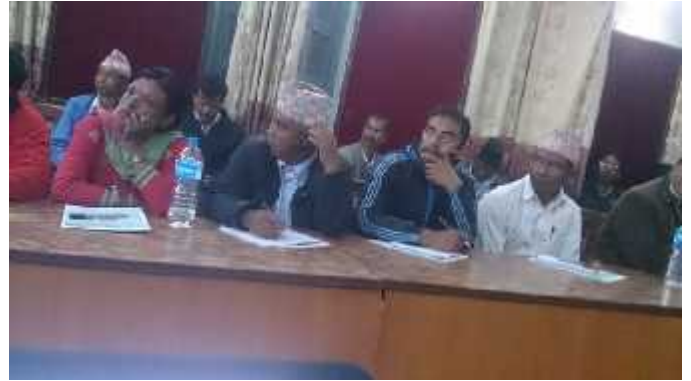
सामाजिक परिक्षणको प्रारम्भिक प्रतिवेदन प्रस्तुतिकरण कार्यक्रमका तस्वीरहरु