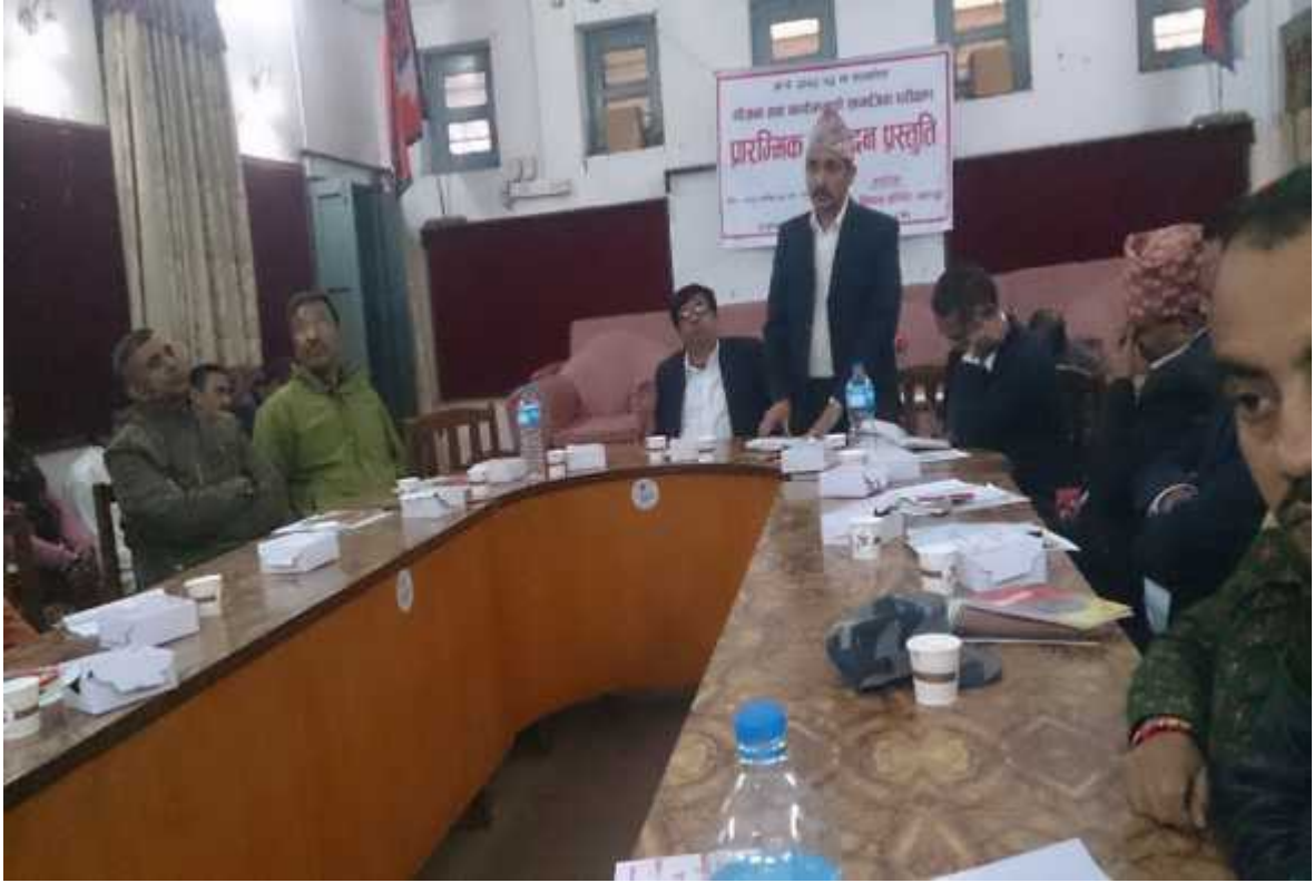
छलफल पश्चात कार्यक्रमको समापन गर्दै स्थानीय विकास अधिकारी